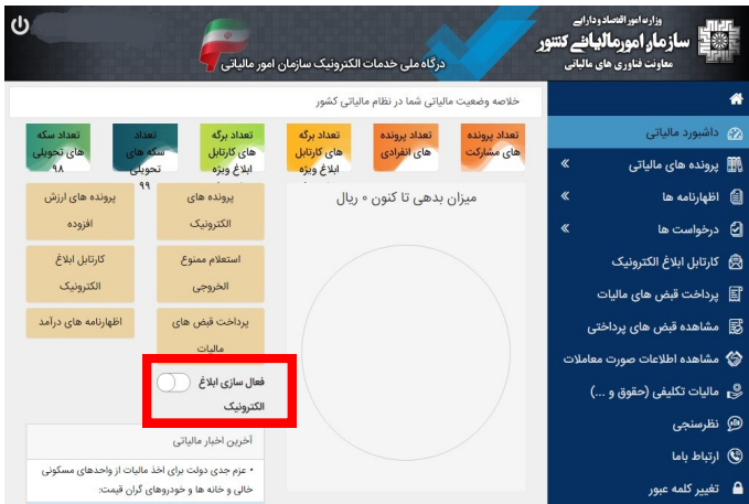
شکل شماره ۲

نکته مهم: صرفاً یک بار فعال سازی ابلاغ الکترونیک برای هر یک از مؤدیان کفایت دارد. بنابراین اگر مؤدی قبلاً ابلاغ الکترونیکی اوراق مالیاتی را برای هر یک از منابع مالیاتی خود (مشاغل، املاک اجاری و ...) فعال کرده باشد، تمامی اوراق صادره در منابع مختلف مالیاتی به صورت الکترونیک به وی ابلاغ خواهد شد.