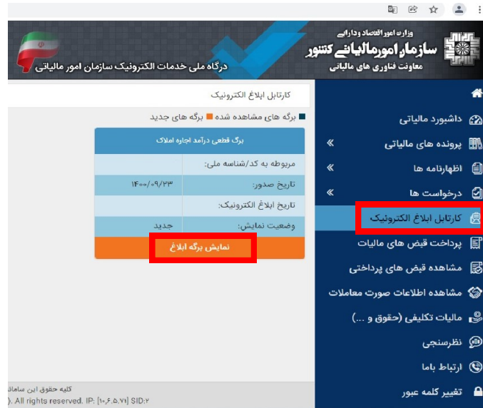
شکل شماره ۳

برگه مالیاتی و تاریخ رؤیت به عنوان تاریخ ابلاغ محسوب می شود. چنانچه مؤدی ظرف ده روز به حساب کاربری خود مراجعه نکرده و برگه بارگذاری شده را مشاهده ننماید، روز یازدهم (یا اولین روز کاری بعد از روز دهم) به عنوان تاریخ ابلاغ قانونی در نظر گرفته می شود. بنابراین مهلت های قانونی جهت اقدام آتی در مورد اوراق مالیاتی حسب مورد، از تاریخ های مذکور آغاز می شود.